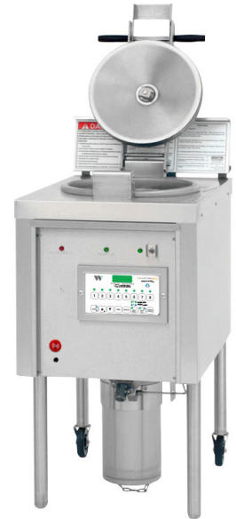
PF46 ET PF56 COLLECTRAMATIC® FRITEUSE À HAUTE PERFORMANCE

Ventilation requise. Vérifiez les codes locaux.